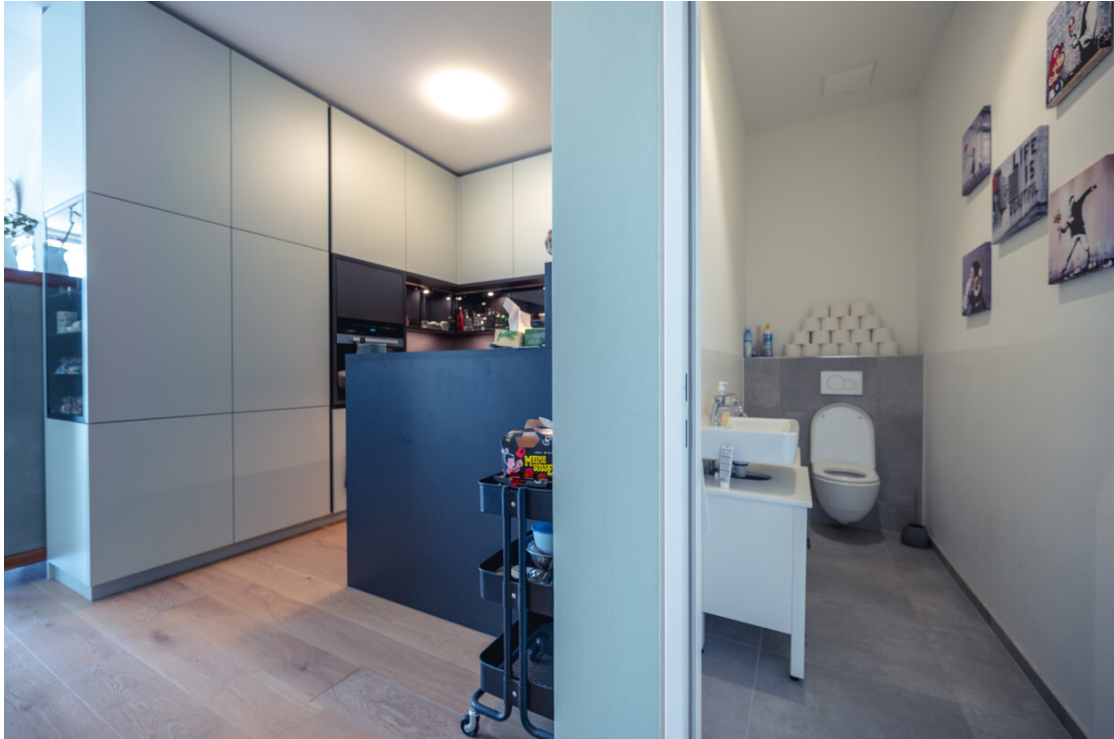
Küche / WC