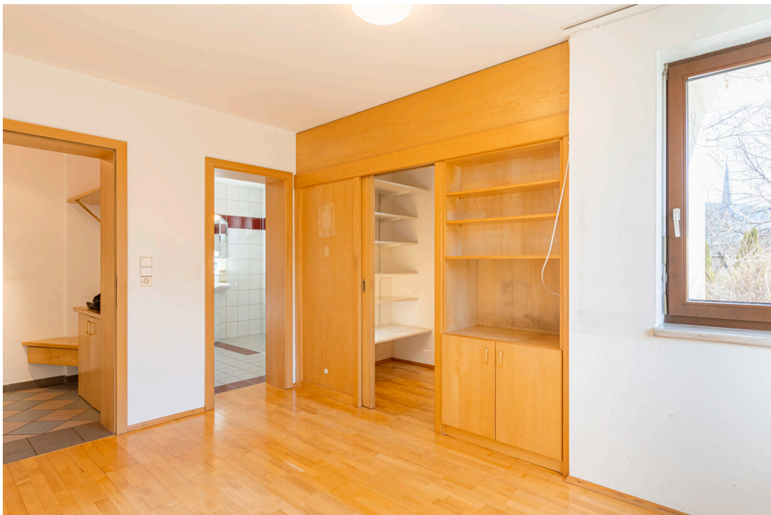
Schlafzimmer mit begehbarem Kleiderschrank