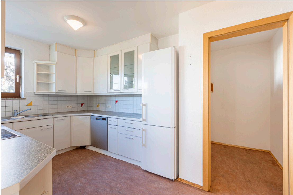
Küche mit Speis