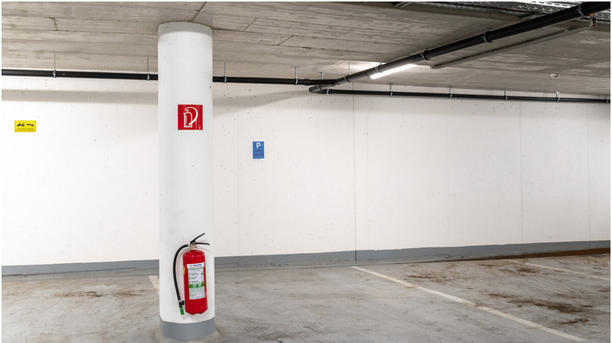
Bsp. Nr. 114