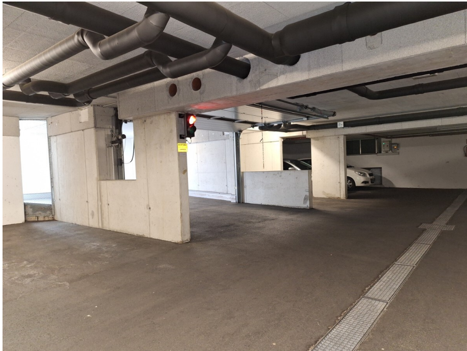
Auf/Abfahrt mit elektrischem Tor